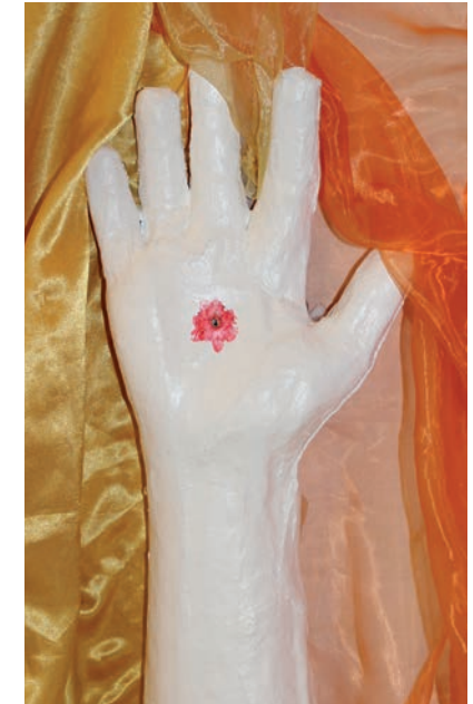
Jesus lebt – auch für Dich (Lukas 24,4-9)