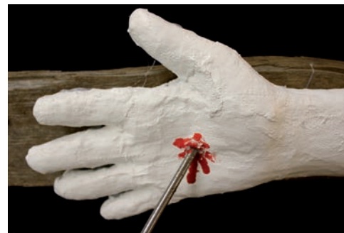
Jesus stirbt für uns (Markus 15,22-39)