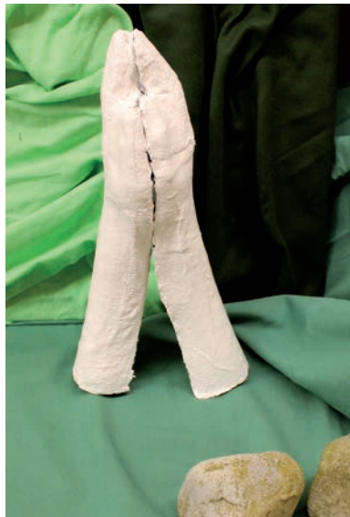
Jesus betet (Lukas 22, 39-41)

Ich lade Sie ein, sich einmal anders auf Passion und Ostern einzustimmen, indem Sie diesen Bildern vom Passionsweg entlang meditieren, mit dessen Gestaltung der Mädchentreff einen Bibelpreis gewonnen hat.