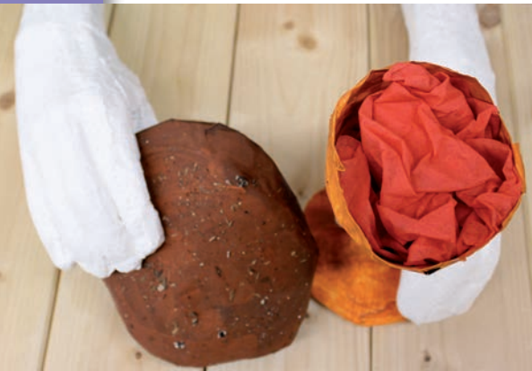
Jesus reicht Brot und Wein (Markus 14, 22-26)