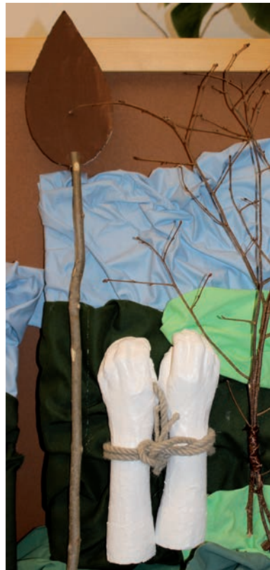
Jesus wird festgenommen. (Lukas 22, 47-52)