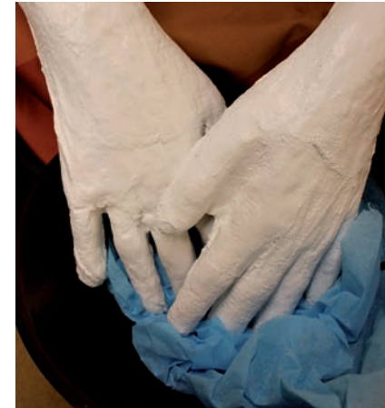
Pilatus: Ich bin unschuldig - und wir? (Matthäus 27, 20-24)